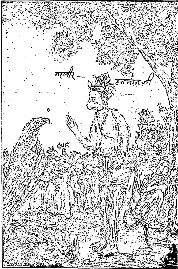
सहकीर और सम्पाति